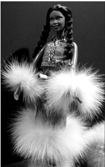
Inuitská barbie (2012)

„Vypracovat se k takovému řádu života, který lze označit životním slohem v pravém slova smyslu, předpokládá kulturní stagnaci, k níž značnou měrou dospělo civilizované lidstvo v středověkých dobách. Proto také středověký život dospěl více méně k nějakému životnímu slohu, kdežto moderní lidstvo má spíše než životní sloh toliko zvláštní životní způsoby, velmi často se měnící. To proto, poněvadž velmi často se lidé cítí jimi utlačováni a hledají nové.“