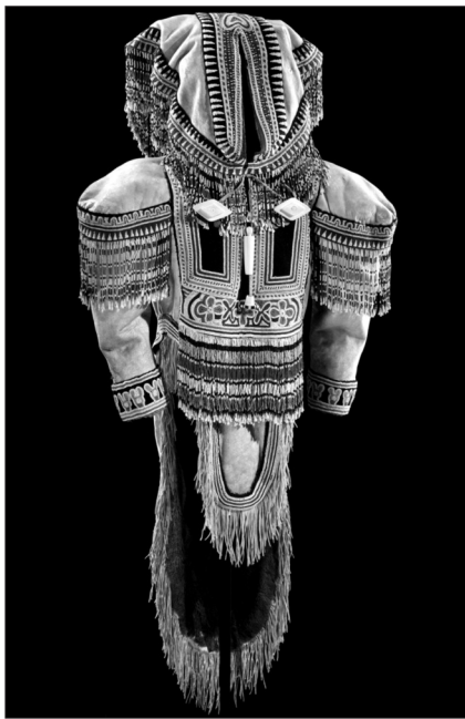
Inuitské tulli a parka (19.–20. stol.)