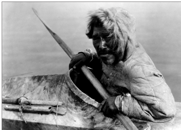
Inuita a jeho obydlí