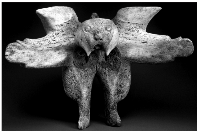
Inuitská soška z kosti