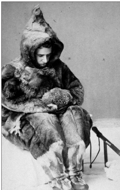
Franz Boas na Baffinově ostrově (1883)